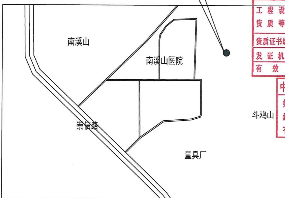
项目地块区位示意图