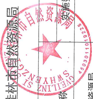
桂林市自然资源局（部门）2024年度行政征收实施情况统计表